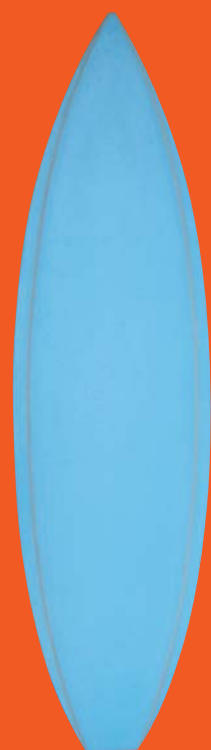
スタイロパラボリック