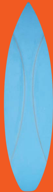
スタイロリバースパラボリック