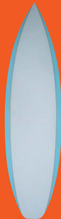
スタイロ+b's MIXパラボリック